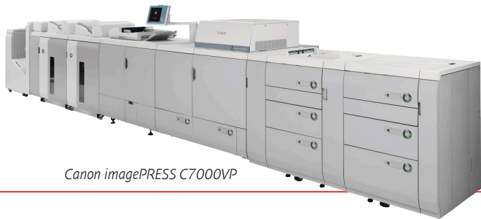
Canon imagePRESS C7000VP